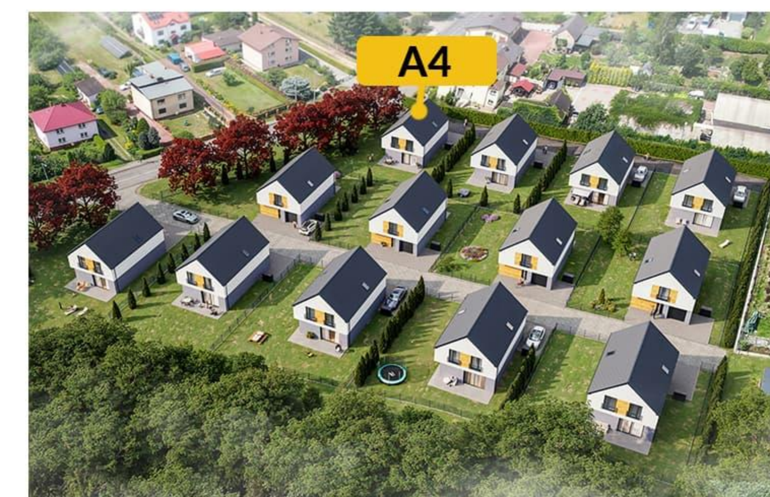
Widok osiedla z lotu ptaka