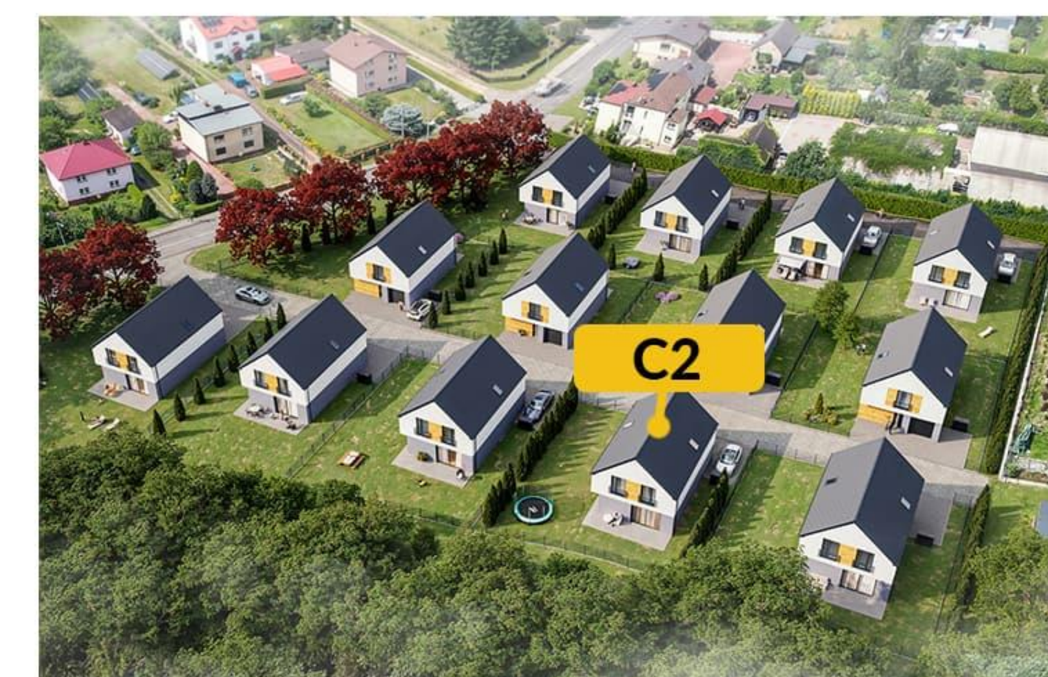
Widok osiedla z lotu ptaka